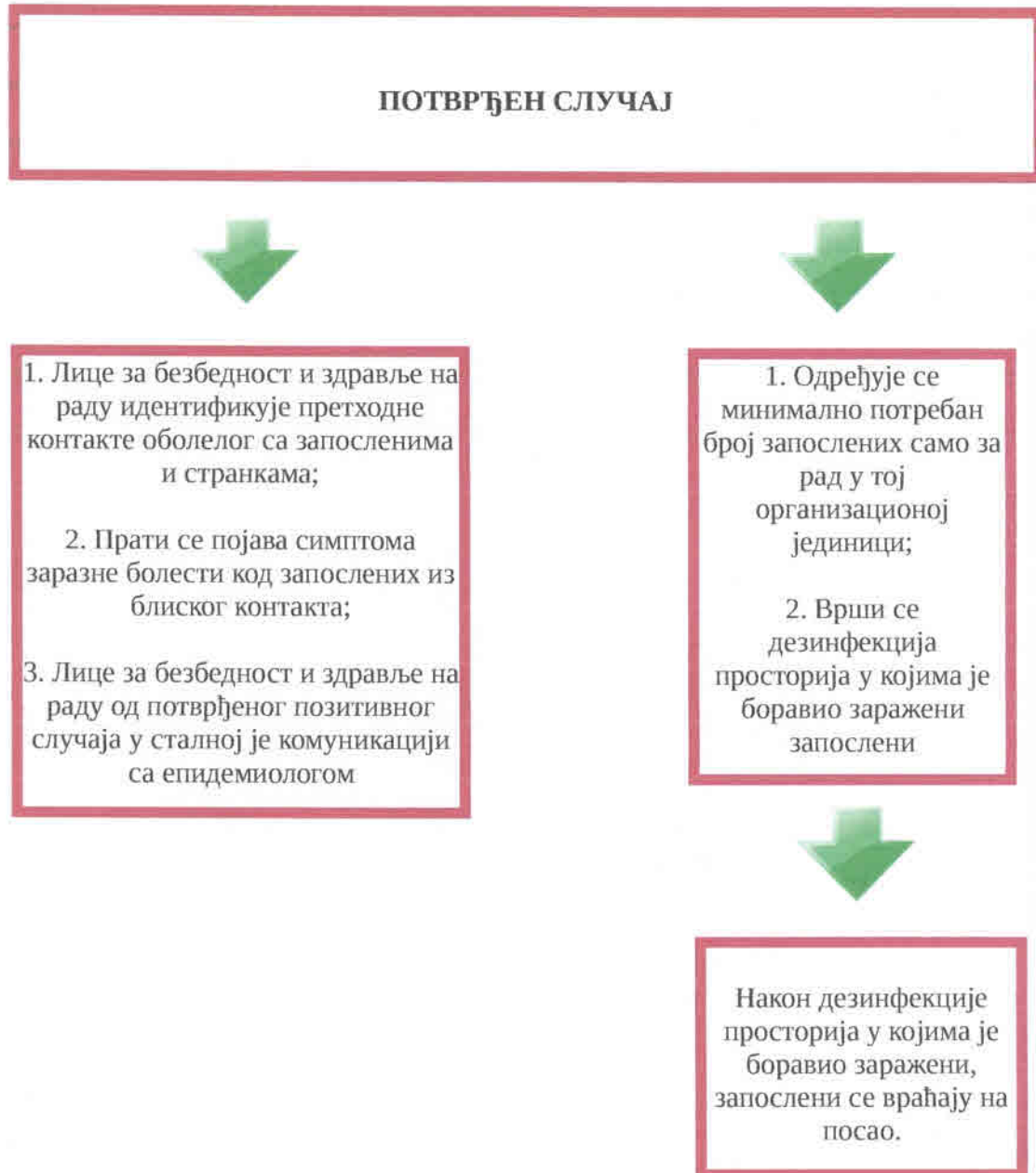
Шема бр. 2: Поступак након потврђеног случаја COVID-19 ради спречавања ширења